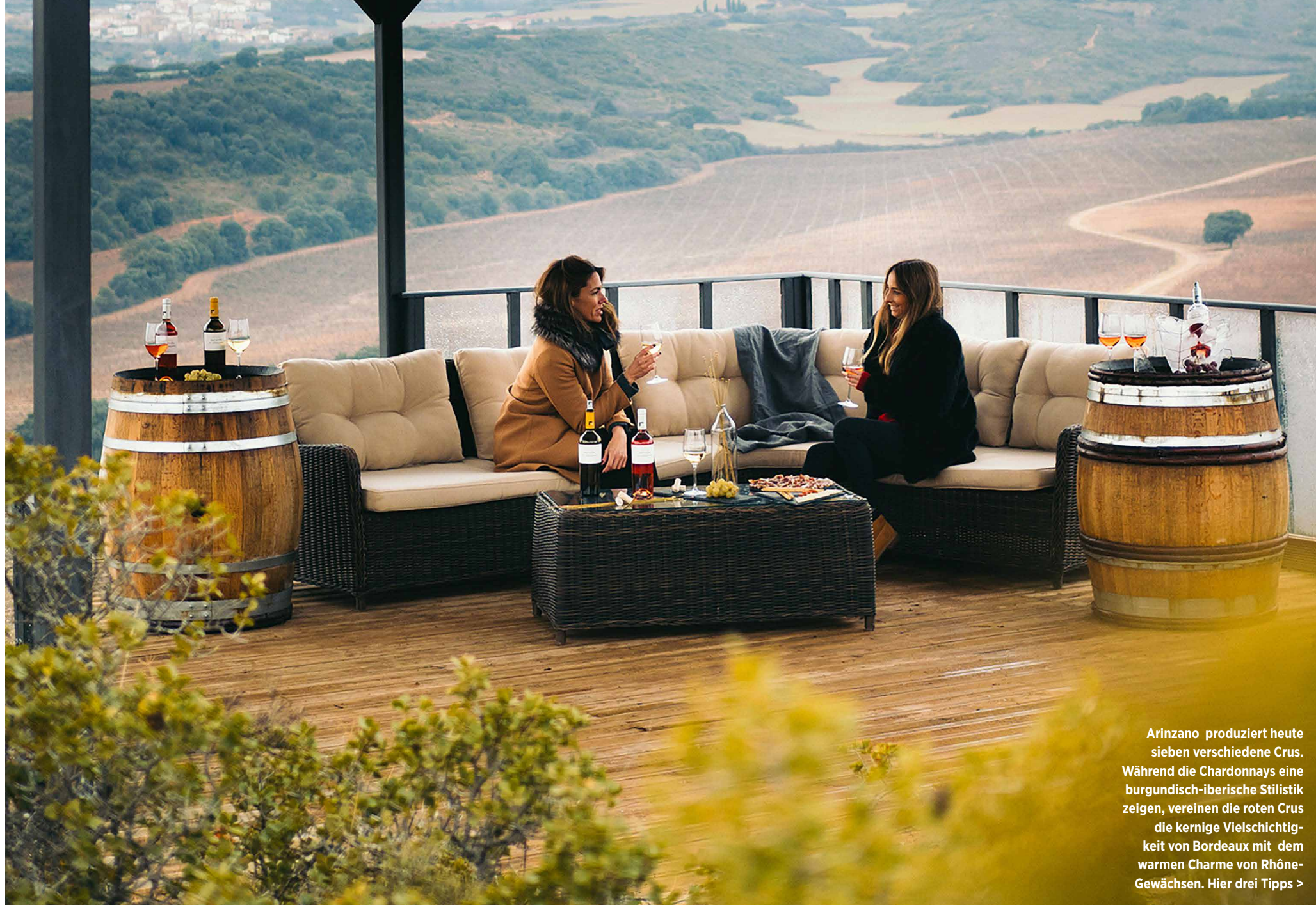
Arinzano produziert heute sieben verschiedene Crus. Während die Chardonnays eine burgundisch-iberische Stilistik zeigen, vereinen die roten Crus die kernige Vielschichtigkeit von Bordeaux mit dem warmen Charme von Rhône-Gewächsen. Hier drei Tipps >