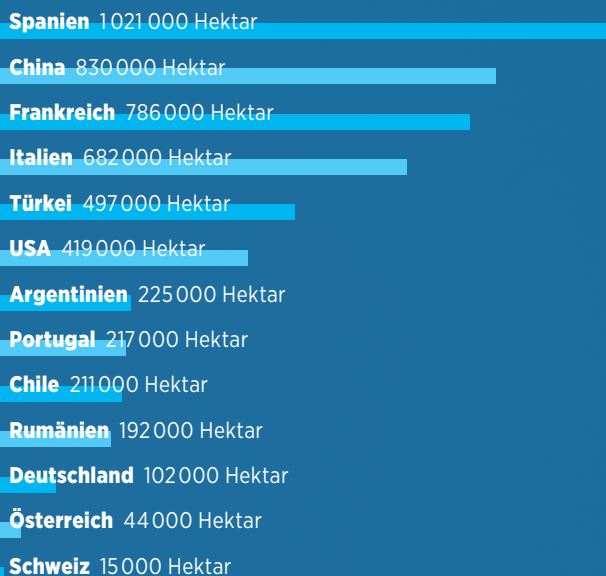
Rebflächen weltweit inkl. Tafeltrauben, Rosinen, Säften usw.

Hektar. So viel Chasselas wurde in den 80er Jahren in der Schweiz ausgerissen.